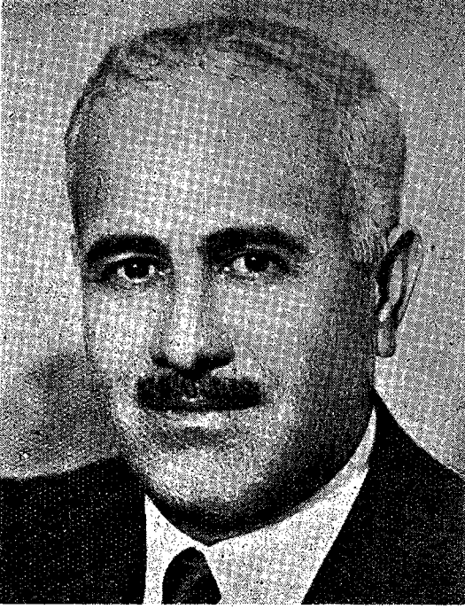
Bayındırlık Bakanı ETEM ERDİÑ

Bayındırlık Bakanı Etem Erdiñ, 1913 yılında Kütahya'da doğmuş, ilk ve orta tahsilini Kütahya'da, lise tahsilini Bursa'da yapmıştır.