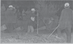
Ankara-EYİHENSEL İnşaat Mühendisleri Odası (İMO), TCDD Genel Müdürlüğü'ne, Ankara-İstanbul arasındaki rayların yenilenmesiyle açıklamasını "suçun itirafı" olarak değerlendirdi.

İnşaat Mühendisleri Odası, TCDD Genel Müdürlüğü'nün kazanın meydana geldiği Ankara-İstanbul arasındaki rayların yenilenmesiyle açıklamasını "suçun itirafı" olarak değerlendirdi.